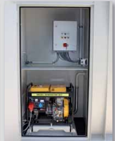
Aggregatnische mit Gen-Set und Zentralsteuerung