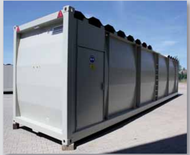
Alle Nischen vandalismussicher durch Türen verschlossen. Tankkörper vor extremer Sonneneinstrahlung durch Sonnendach geschützt.