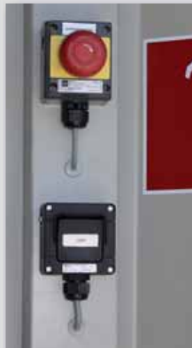
Not-Aus-Taster und Lichtschalter in Ex-Ausführung