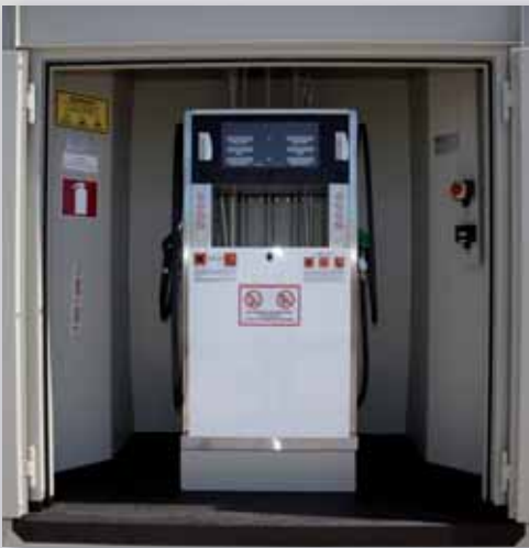
Zapfnische mit Zapfsäule