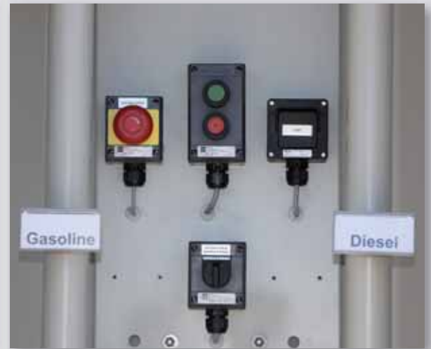
Befüllnische: Betriebsschalter in Ex-Ausführung