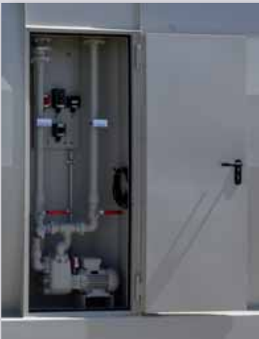
Befüllnische mit Transferpumpe