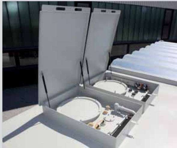
Haubenelemente mit Ausrüstung